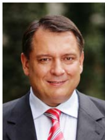
Ing. Jiří Paroubek, předseda, ČSSD

3. České zdravotnictví potřebuje věcnou debatu a určitě by mu prospěla širší politická shoda. K ní však musí být odvaha a vůle. Nestačí mít pouze odborné a věcné argumenty a návrhy, k rozhodnutí o budoucnosti českého zdravotnictví je potřeba politická podpora. Proto se domníváme, že musíme o reformě diskutovat s jinými stranami a jsme na to připraveni. Nicméně, jak jsme se již přesvědčili za dob naší vlády, debata o zdravotnictví nebyla konstruktivní, nevycházela z faktů a zřetelných argumentů, ale spíše jsme se setkali s konfrontací za každou cenu. Vzpomeňme na náš projekt Kulatého stolu, který měl takovou platformou být a který ČSSD jako jediná parlamentní strana bojkotovala. Širší politikou shodu jsme přesto připraveni dále iniciovat a hledat. Je to úkol těžký, ale potřebný.