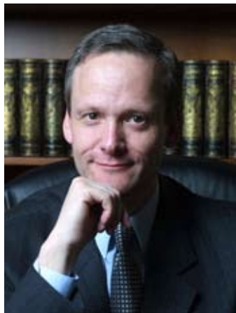
JUDr. Cyril Svoboda, předseda, KDU-ČSL

3. Myslíme si, že v tomto případě se rozhodně nemusí jednat o utopii. Je třeba chápat, že každá rozumná politická strana, každý rozumný občan má zájem na zlepšování situace v českém zdravotnictví, proto také sociální demokraté nabízejí široký program opatření, který by k takovému zlepšení vedl. Tato opatření, stejně jako mnohá další v jiných tématech, jsme také nabídli k diskusi odborné i laické veřejnosti. Pro nás je nejdůležitější uplatnění principu solidarity. Pokud v tomto bodě bude panovat širší shoda, samozřejmě lze o problematice zdravotnictví dále debatovat.