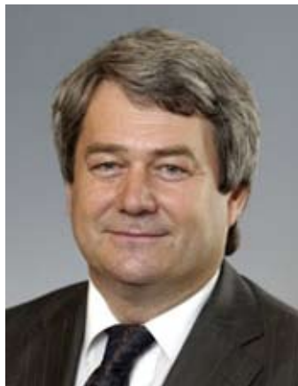
JUDr. Vojtěch Filip, předseda, KSČM

lyzovali řešení problémů. Jsou tu přece od toho, aby je naopak řešili. Bez transformace zdravotnictví ze stávajícího stavu na systém schopný podporovat zdraví a léčit pacienty i v jejich domovech se do budoucna s ohledem na stárnutí populace neobejdeme.