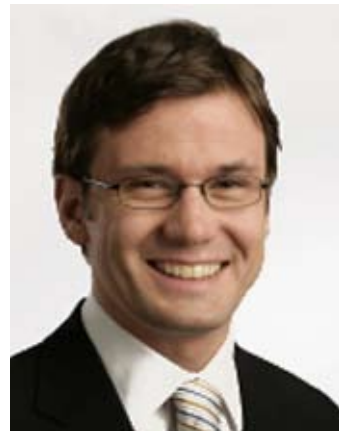
Mgr. Ondřej Liška, předseda, Strana zelených

předvolební válkou o poplatky a stále čeká na novelizaci zastaralého zákona o zdraví lidu, který řadu dnes běžných a progresivních metod péče jednoduše nevzná. Dlouhodobým problémem je nedostatečné ohodnocení zdravotnických profesionálů a jejich odchody do komerční sféry a/nebo do zahraničí. Tento trend ohrožuje zřejmě nejsilnější stránku českého zdravotnictví, kterou stále ještě jsou, a doufejme, že i budou, lékaři a zdravotní sestry.