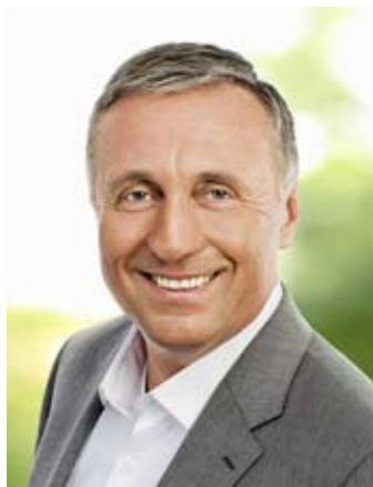
Ing. Mirek Topolánek, předseda, ODS

3. Stěží, v poslední době se u nás zavádí móda nedodržování elementárních dohod. Základní etická pravidla politické slušnosti, opravdu ta nejzákladnější, jsou porušována kupeckými počty a kupeckými manýry. Pro dosažení změny ve zdravotnictví je potřebná silná a schopná vláda a korektní partneři.