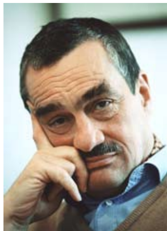
Karel Schwarzenberg, předseda, TOP 09