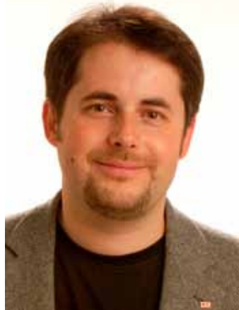
Marek Jukl, Ph.D. prezident, Český červený kříž

1. V posledních letech opravdu dochází k poklesu počtu tzv. prvodárců – tj. nových dárců krve. Neřekl bych ale, že lidé přestávají být vnímaví k osudu druhých. Spíše mají řadu starostí v osobním životě a také jim chybí informace, co se od nich, jako potenciálních dárců krve, očekává. Český červený kříž se snaží právě onen „informační deficit“ odstranit – propagace bezplatného dárcovství krve a jejích složek je jednou z jeho významných programových činností. Samozřejmě se mění způsob, jak informace předávat. Hledáme stále nové způsoby, jak „poselství“ o potřebě dárcovství krve šířit – zaměřujeme se hlavně na mladou generaci, kde se nám podařilo „na naši stranu“ získat její